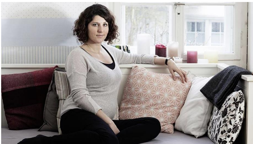
Schwangerschaft oder Abtreibung: Das Thema beschäftigt die Gemüter noch heute, 15 Jahre nach der Fristenregelung.